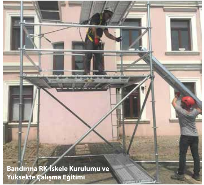
Bandırma RK-İskele Kurulumu ve Yüksekte Çalışma Eğitimi